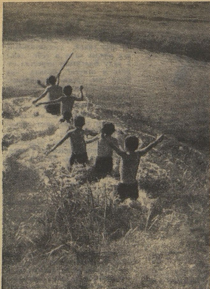
Течёт, гетляет речка-невеличка. Но и на малой реке бывают омуты и водовороты. И форсировать её не так просто. Вперёд вырвались смельчаки — мальчишки из деревни Курманаево Марийской АССР.